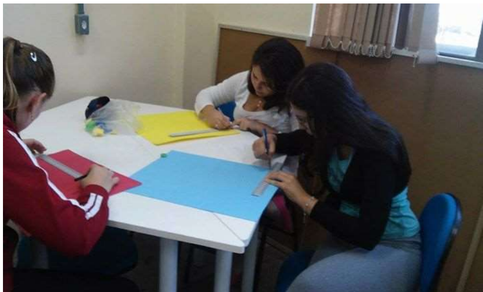
Figura 1: Elaboração dos materiais para as atividades