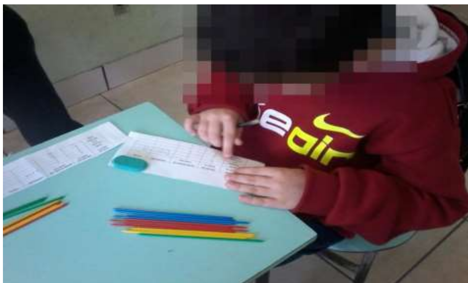
Figura 2: Aplicação da atividade pega-varetas

No decorrer das atividades, pôde-se notar um grande entusiasmo por parte dos alunos, percebendo-se que eles compreenderam os conceitos que eram apresentados através dos jogos, criando estratégias no decorrer do jogo, além de desenvolverem as ideias de multiplicação ali presentes.